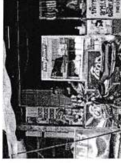
ร้านค้าที่ต้องเสียภาษี